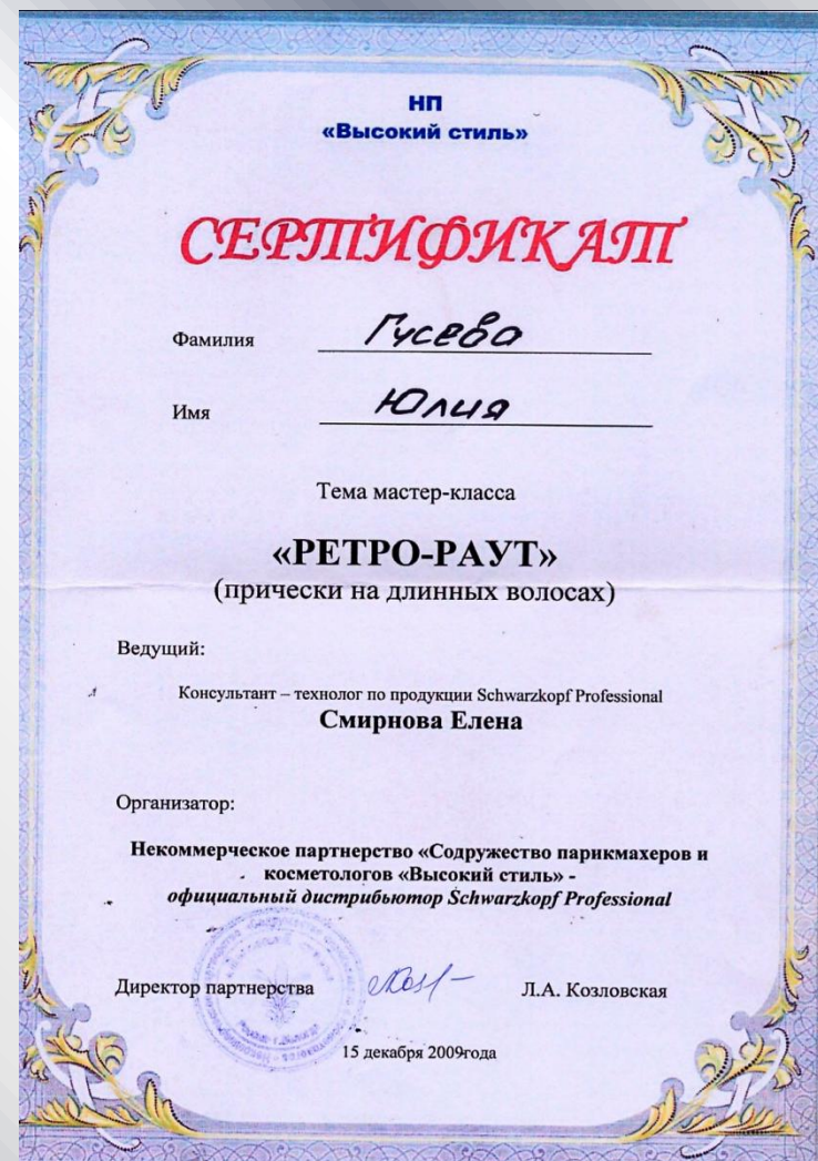
Мастер – класс «РЕТРО – РАУТ» 2009 г.